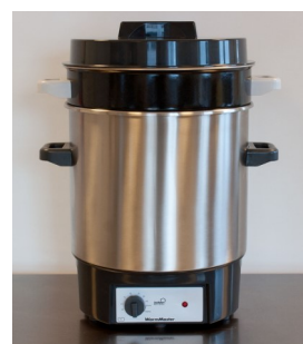
Optionele e-maille inzetpan (art. 8401.01)