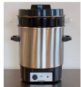
Optionele e-maille inzetpan (art. 8401.01)