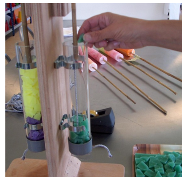
Moderne fakkels in frisse kleuren, met brokjes of door- en door gekleurd.